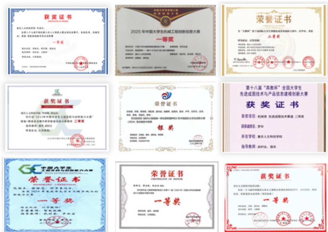
图 9. 学生参加学科竞赛部分获奖证书

依托“课堂小实验 - 实验室实验 - 开放实验”的实践体系，课程实现了学科竞赛、企业项目与教学内容的融合。学生参与大学生机械创新设计大赛、机器人类比赛等赛事的积极性明显提高，两年内累计斩获国家级奖项 18 项、省部级奖项 70 余项（图 9）。这些成果充分印证了 P-MADE 循环中“设计解决”与“效果评估”环节的实践价值，推动了理论知识向实践应用的有效转化，彰显了该教学模式的实践育人成效。