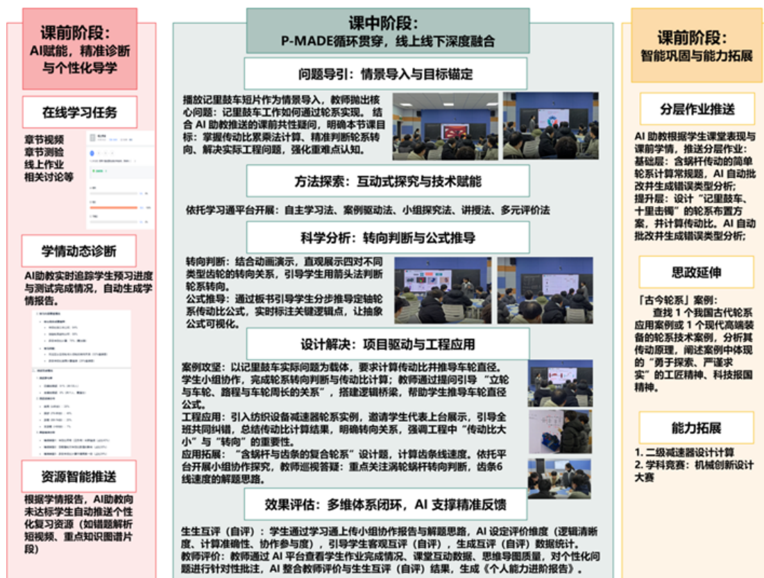
图 8. 全流程闭环教学实践