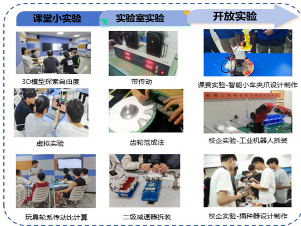
图 4. 递进式实践模块