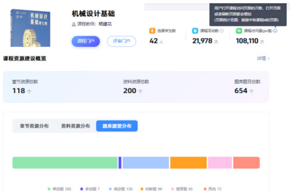
图 2. 在线课程平台的资源库