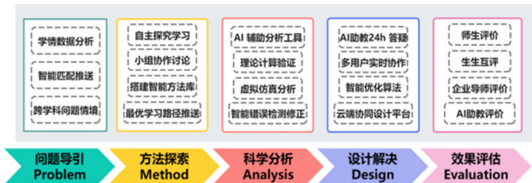
图 5. P-MADE 设计型循环教学模式