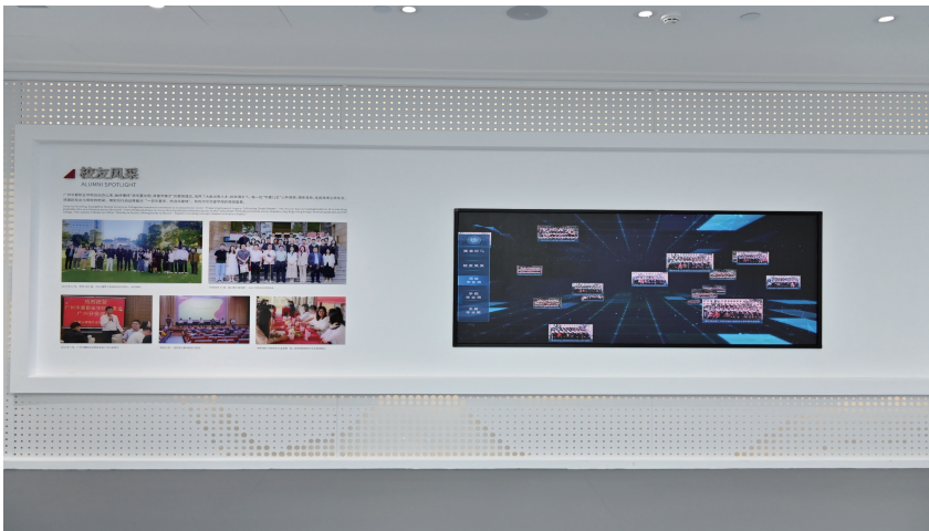
图 6. 互动魔屏设备展示实景

传统的校史馆布展多为单向的信息输出，参观者只能被动地接受信息。广州华夏职业学院在校史馆布展设计中，注重克服互动性不足的问题，避免停留在单向信息传递模式，致力于增强参观的趣味性和参与度，充分发挥校史馆的教育功能。为此，校史馆设置了互动体验区，配备触摸屏、体感设备等，例如，在展厅中设备为互动魔屏设备，以触控点击形式，展示“华夏儿女——优秀校友之风采”，让参观者能够与展览内容进行互动。同时，规划了电子查询系统，使部分内容能够实现人机对话，改变单向信息输出的模式。通过这种方式，参观者可以根据自己的兴趣和需求，主动查询相关信息，增强与校史馆的互动性，深入了解学校历史（图 6-7）。