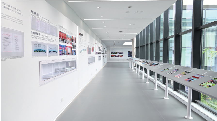
图 4. 第二展厅