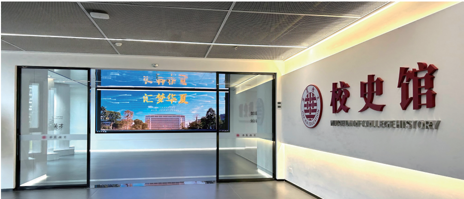
图 2. 校史馆大门，学校档案室摄

在主展厅，学校通过“党建引领”、“依法治校”、“教育教学”、“科研服务”、“产教融合”、“招生就业”、“教师队伍”、“校园文化”、“基建建设”、“师生风采”、“国际交流”等多个主题版块，全面展示学校当前的办学成果。例如，“教育教学”版块着重呈现出学校教学成果的系统性，以“成果简介、教学推广、创新应用”三个维度，对国家级、省级、校级教学成果奖进行阐释。在未来展厅，学校以时间为轴，以梦想为画笔，展示未来的发展规划，以及围绕“创百年名校，做最有中国特色和品质的民办高校”的愿景，逐步展开学校在战略发展、学科建设、人才培养与国际交流合作等方面的长期实践路径。通过这些版块的展示，参观者可以清晰地了解学校在各个领域的成就和未来的发展方向，从而增强对学校的认同感和归属感（图 2-5）。