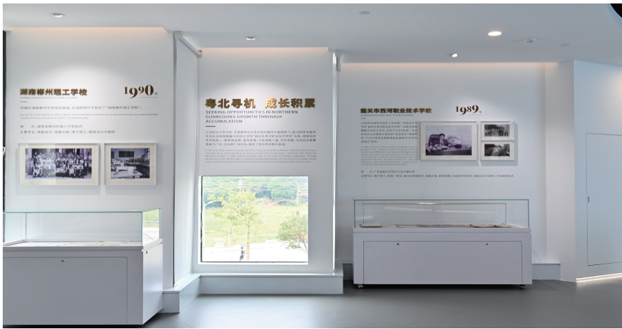
图 8. 湖南韶关办学展柜

广州华夏职业学院采用场景复原、模型展示、艺术装置等多元化的展示手段，增强展览的视觉冲击力和感染力。例如，通过复原历史场景，让参观者身临其境地感受学校发展的重要时刻；利用对比图片展示校园变迁，直观呈现学校的发展历程。校史馆注重展览的空间设计和氛围营造，通过合理的空间布局、灯光设计和色彩搭配，提升整体的展示效果。在校史馆的管理上，该校采取独立建制，以学生社团的管理模式，计划培养一支专业的讲解员队伍。通过系统的培训，使讲解员不仅能够清晰地讲述学校的历史，还能生动地讲述学校的故事，传递学校的精神和文化。目的是将参观校史馆的过程转变为一次润物无声的立德树人过程，让参观者在参观中受到启发，增强对学校的认同感和归属感（图 8）。