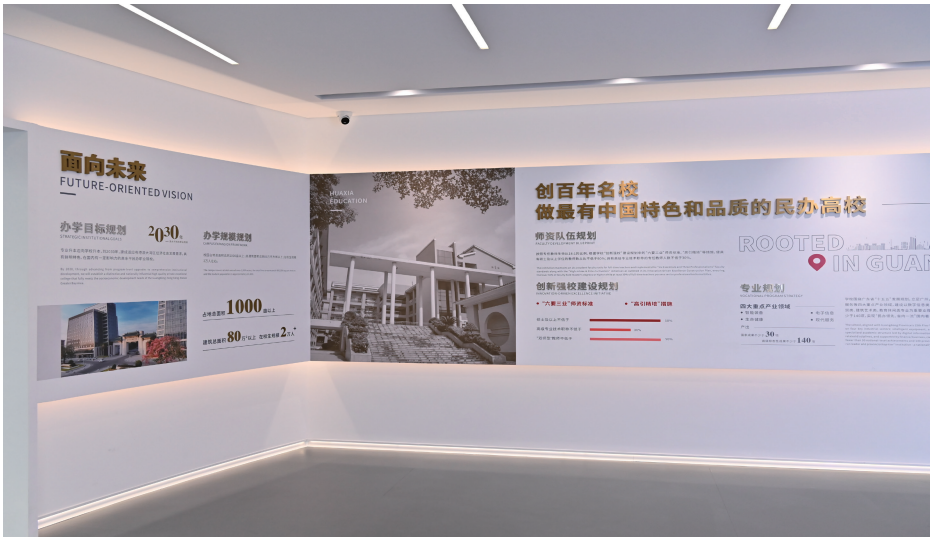
图 5. 第三展厅