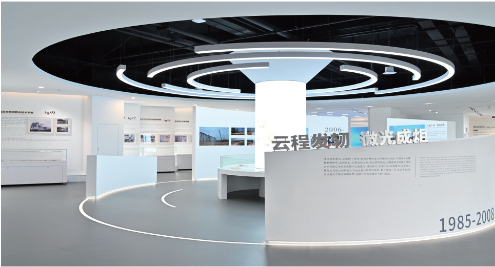
图 3. 第一展厅